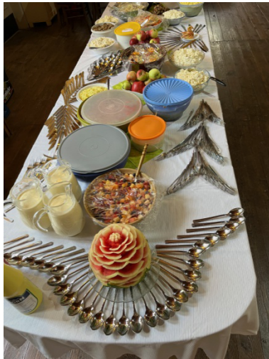
Beeindruckende Dekoration mit Essbesteck, herzlichen Dank