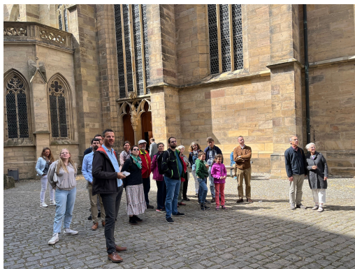
Stadtspaziergang: Auf dem Domberg