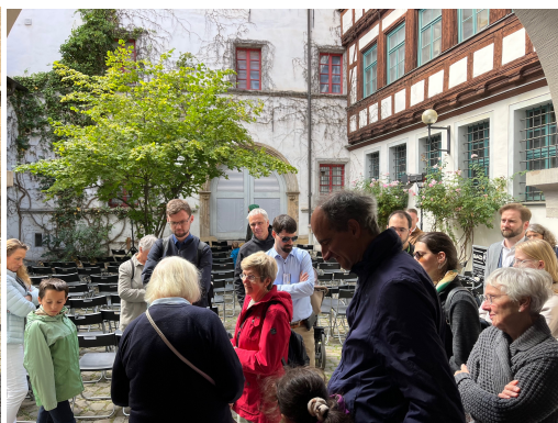
Im Hof des ehem. Betsaales, Große Arche 14, Kirche 1844 bis 1913

Die vierte Tagung „Gemeinsam Glauben“ findet am 22. und 23. August 2026 wiederum in Erfurt statt.