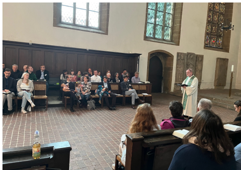
Morgenandacht in der Augustinerkirche