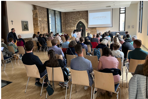
Tagungsraum im Augustinerkloster