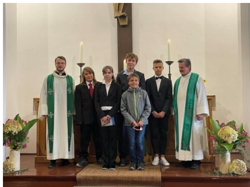
Gotha Konfirmation , 10.10.2021