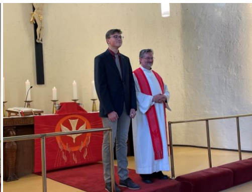
Erfurt Konfirmation , Reformationstag 2021