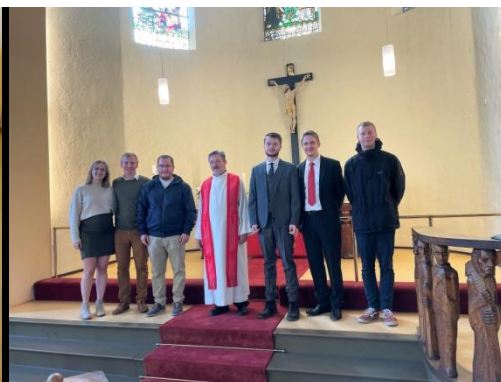
Erfurt Reformationsfest 2021 Besuch Theologie-Studenten